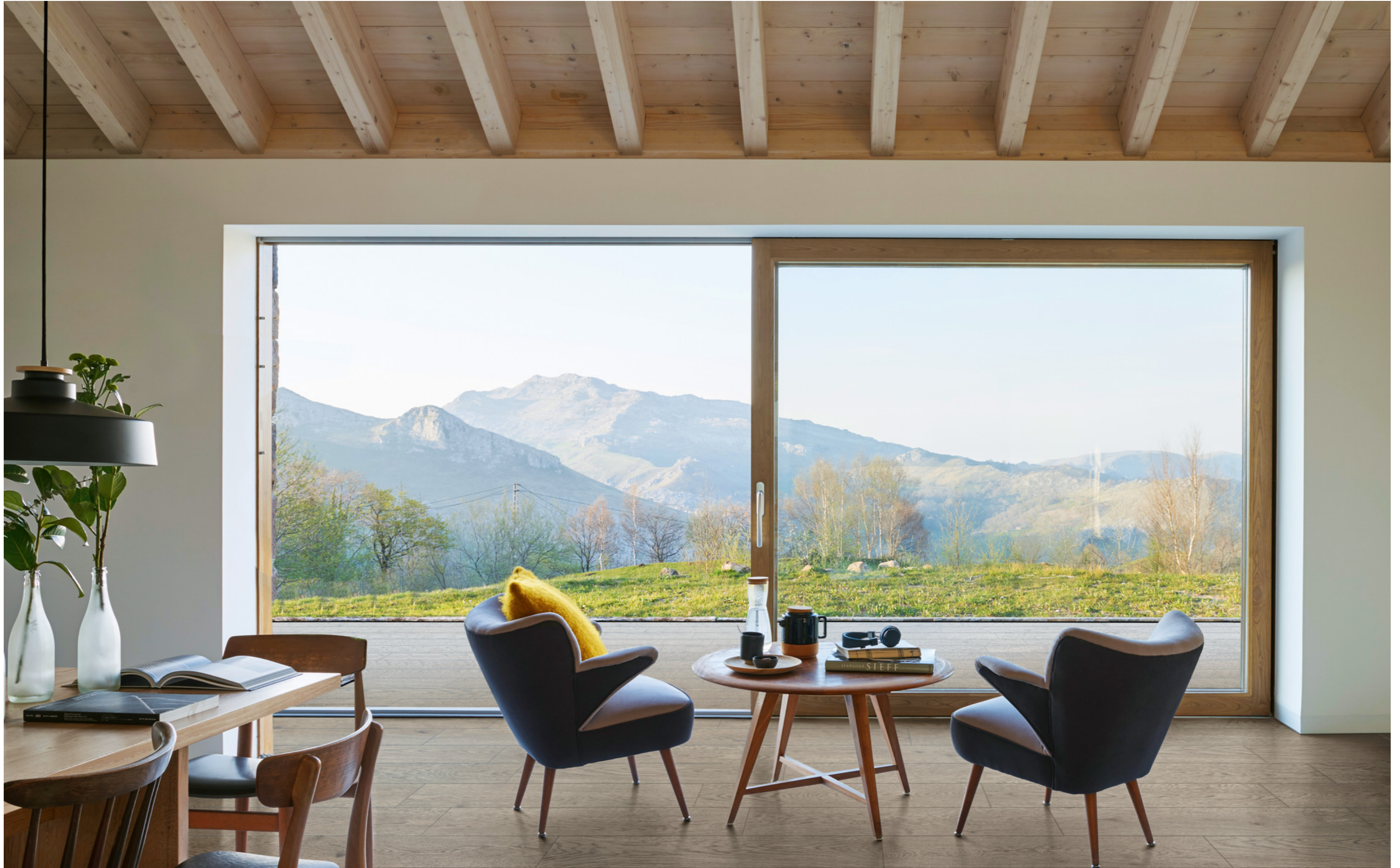
MMDL Vivo Tabacco Grip 20x120cm MMDC Vivo Tabacco Rt 20x120cm