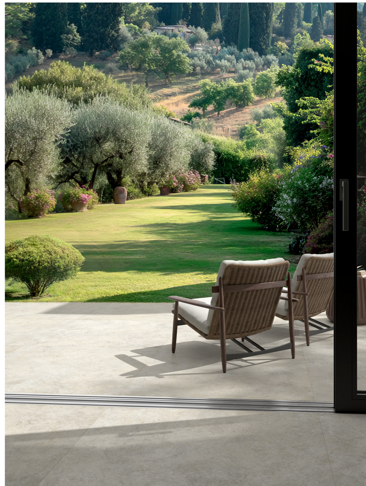
MQAR Mystone Tivoli Grigio Strutturato Rt 120x120cm MQAP Mystone Tivoli Grigio Rt 120x120cm