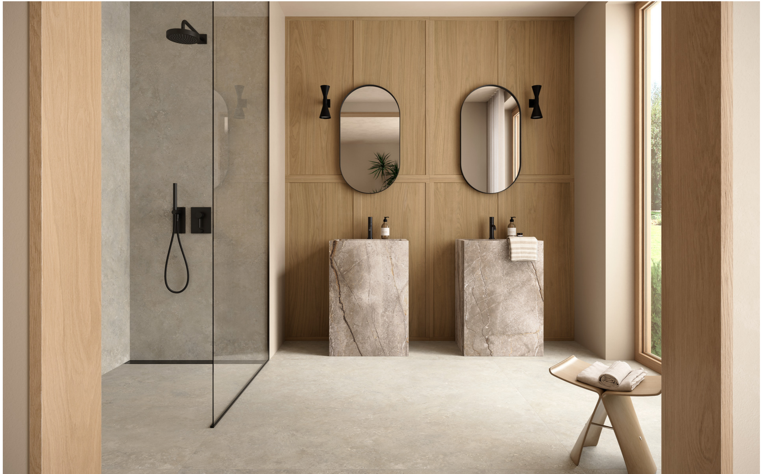
MQ9M Grande Stone Look Tivoli Grigio Satin 3D Ink Rt 160x320cm MM19 Grande Stone Look Silver Root Grey Satin 3D Ink Rt 6Mm 160x320cm