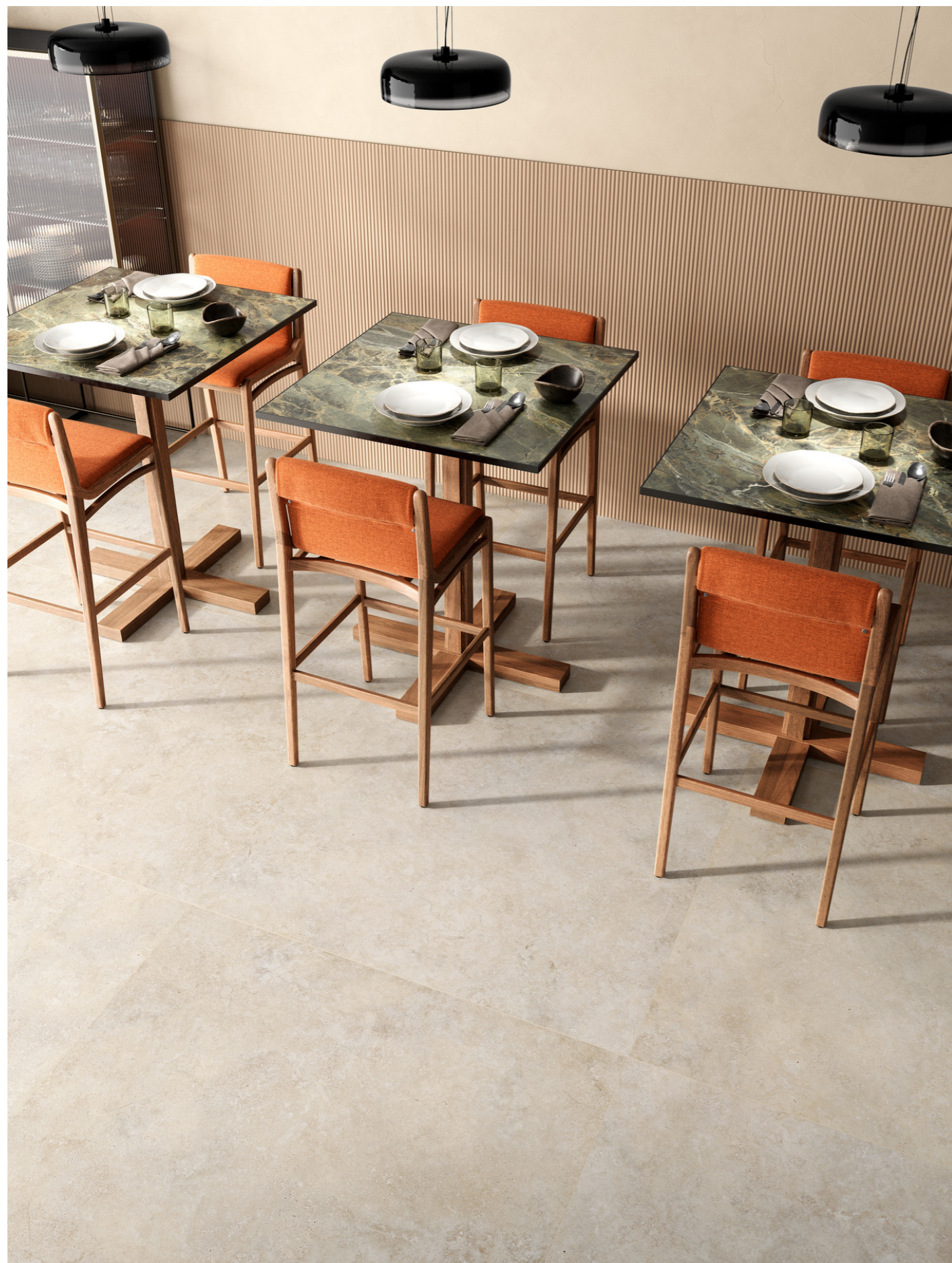
MQDW Crea Forma01 3D Rovere Scuro Rt 60x135cm MQAN Mystone Tivoli Bianco Rt 120x120cm MAFX Grande Marble Look Verde Borgogna Satin Rt 6Mm 160x320cm