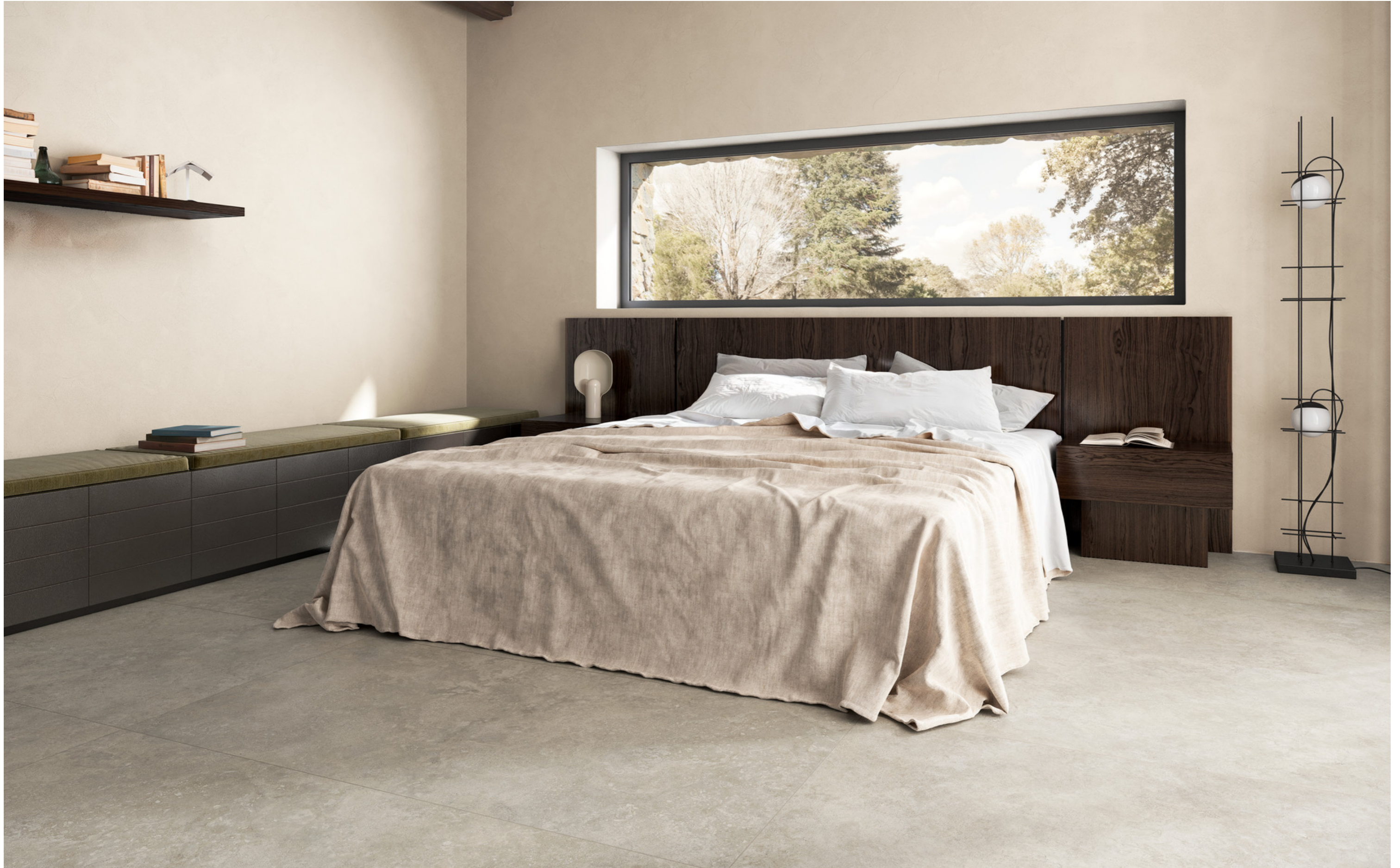
MQCA Mystone Tivoli Grigio Rt 75x150cm MPV6 Terramater Carbone Lux 9x37cm